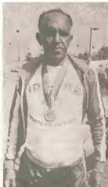
Cu e lema "Deporte pa un y tur", I.D.E.F.R.E. ta dedica su atencion pa tur deportenan sin importa edad.